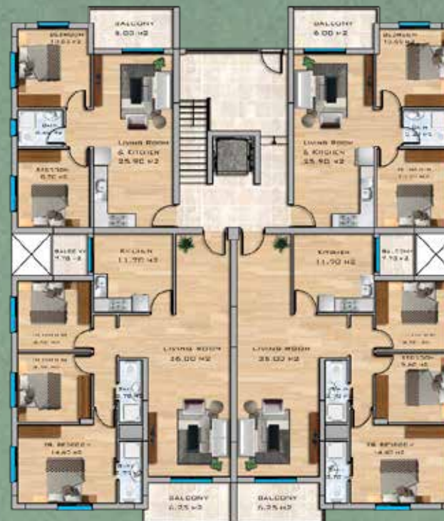
2+1, 3+1 Apartments Ground Floor Plan

پنتهاوس های دو خواب 93m 2 Flat + 91m 2 Balcony