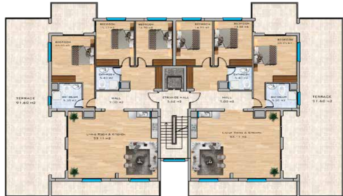
Penthouse Floor Plan