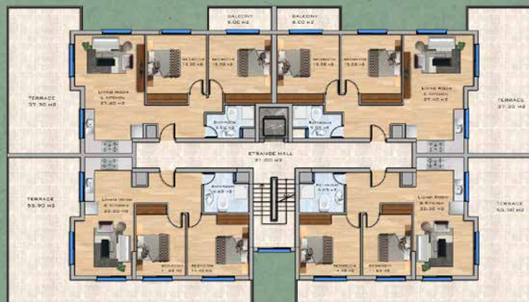
Penthouse Floor Plan