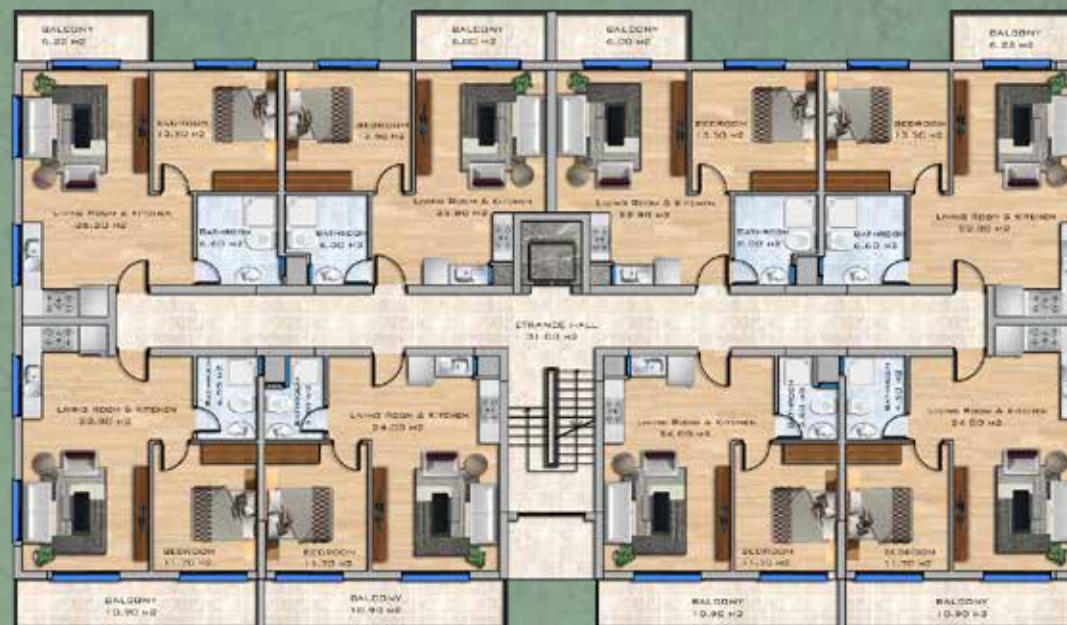
1+1 Apartments First Floor Plan