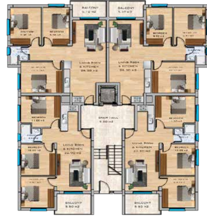
3+1 Apartments Ground Floor Plan