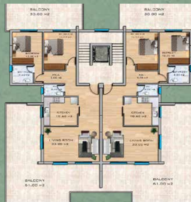
Penthouse Floor Plan