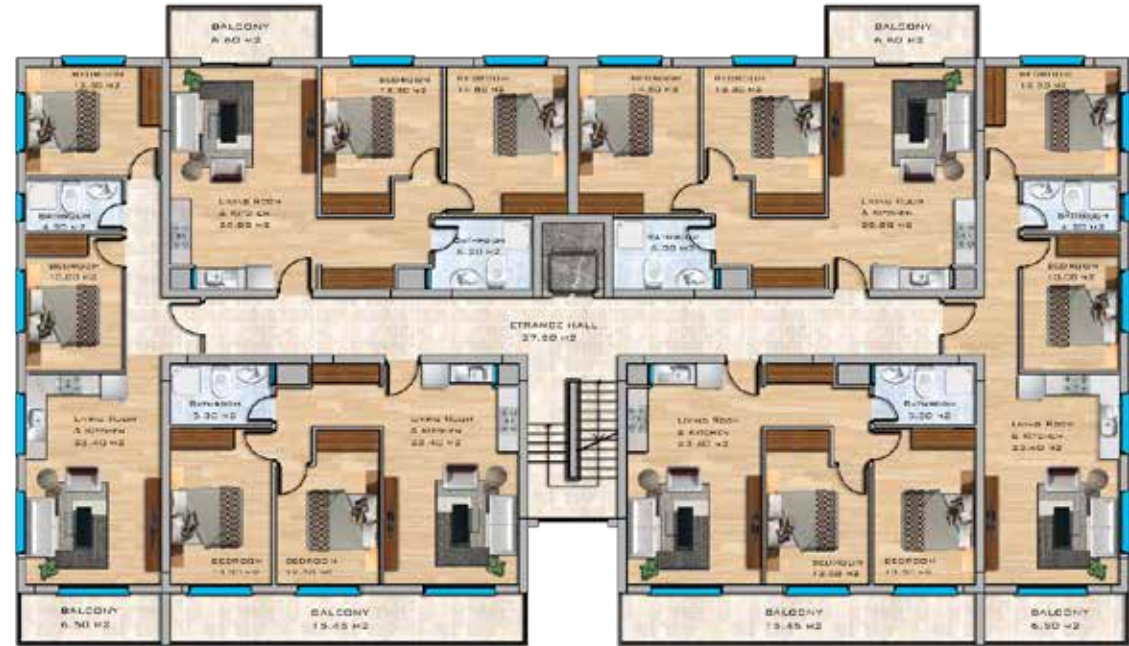
2+1 Apartments First Floor Plan