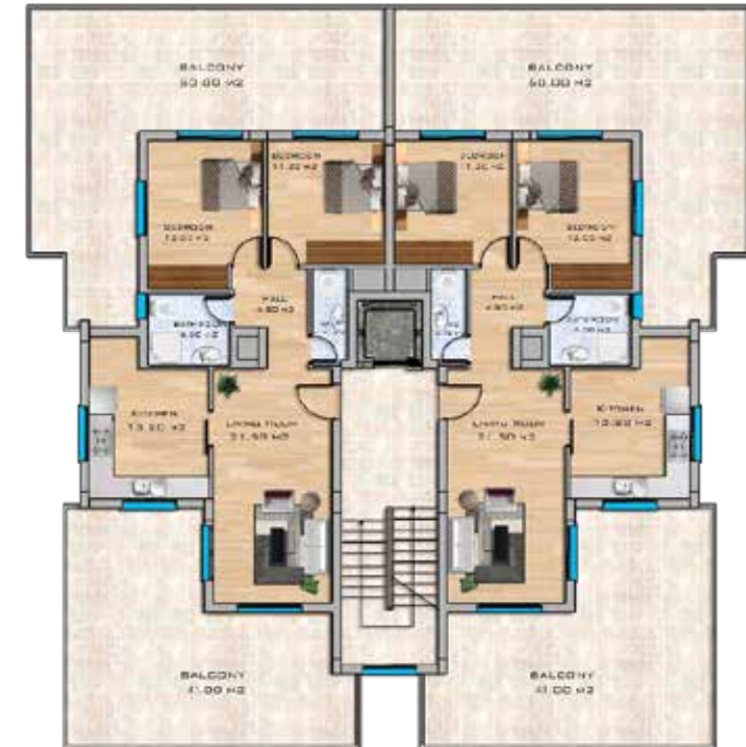
Penthouse Floor Plan